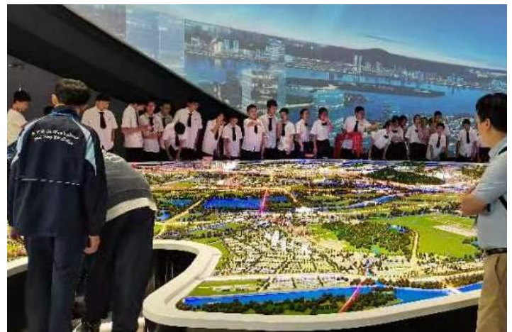
透過對南沙及明珠灣區進行綜合性介紹，增進學生對於明珠灣規劃的認識