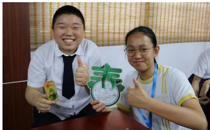
通過一起寫詩，增進彼此友誼；通過互贈卡片，傳遞彼此的祝福。