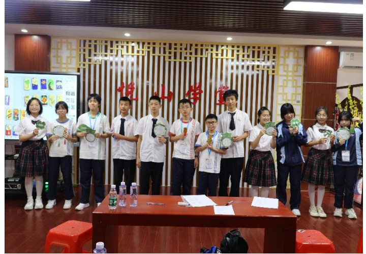
黃閣中學初一(6)班學生向莫慶堯中學的學生贈送自主設計製作的掐絲琺瑯作品