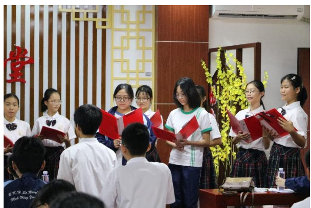
通過誦讀活動，一起感悟春天詩歌之美。