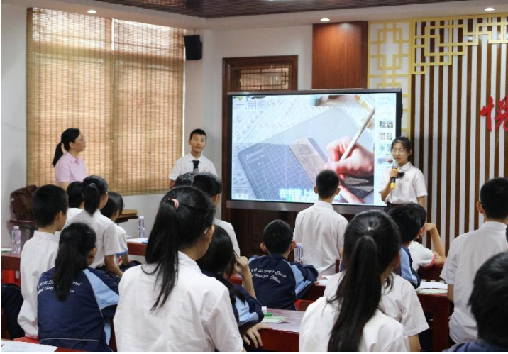
黃閣中學學生參講述與勞動教育的心得體會