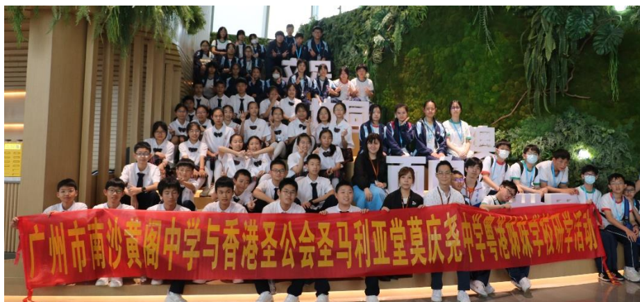
通過研學，帶領學生實景鳥瞰明珠灣全貌及重點工程專案，瞭解南沙的最新發展